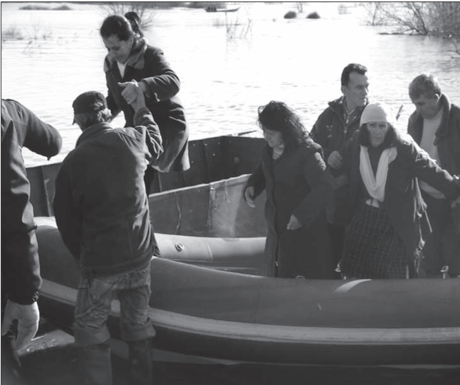
Nach den verheerenden Überschwemmungen in Nordalbanien Anfang des Jahres mussten 5.000 Menschen in Sicherheit gebracht werden.