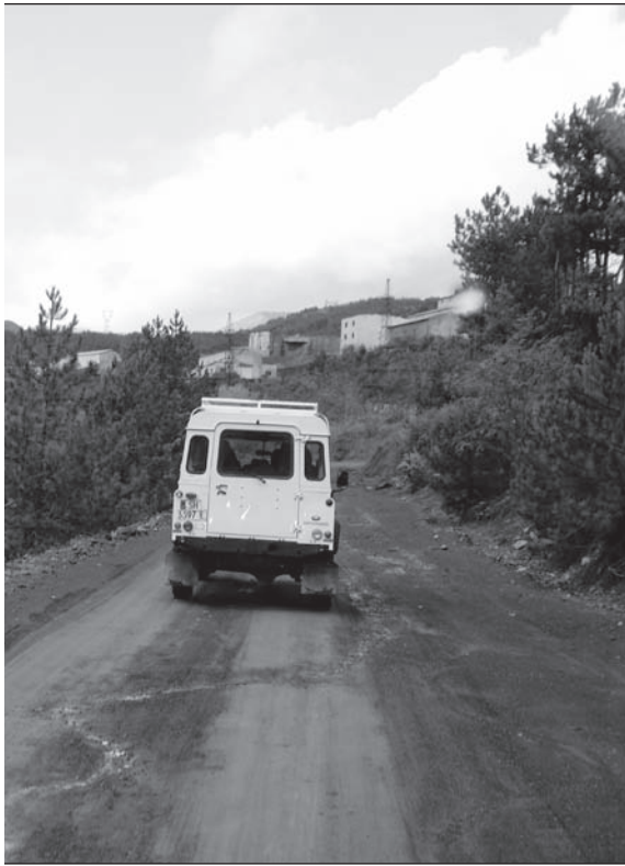
Bis auf eine Strecke von ca. 120 km, die in der Ebene Schlaglöcher und führen bergauf und bergab.